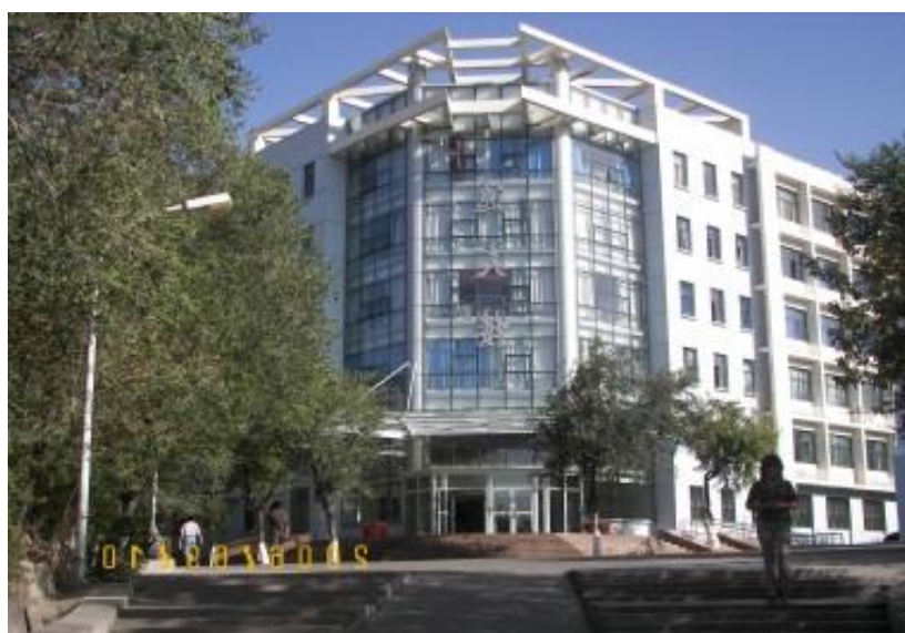
逸夫楼（现教学科研场所）