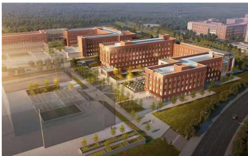
化学学院大楼（新校区 1.8 万平方米）